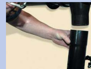
19 - Uzstādiat notekcauruli