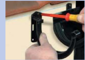
12 - Piestipriniet vajadzīgo kronšteinu daudzumu ar attālumu 40 cm