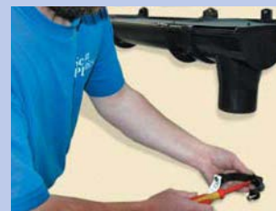
18 - Nostipriniet notekas stiprinājumu taisni pret notekas virzienu ar maksimālo attālumu 1,8 m