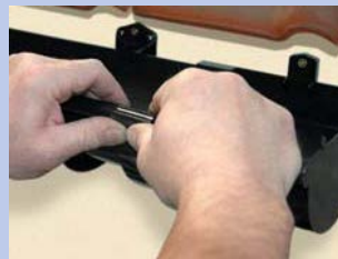
13 - Nostipriniet tekni savienojumā un piltuvē