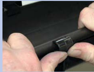
9 - Pēc tam nofiksējiet tekni kronšteinam