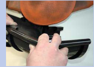
8 - Savienojiet tekni ar stūra elementu