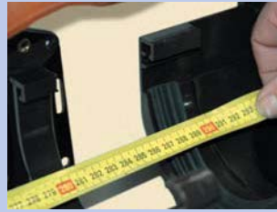
5 - Nomēriet teknes garumu līdz atzīmei "limit position"