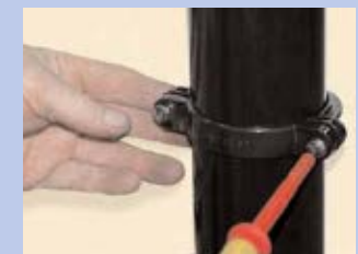
20 - Nofiksējiet notekcauruli ar notekas stiprinājuma palīdzību