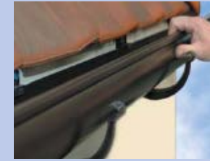
7 - Novietojiet tekni uz kronšteinam