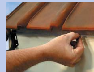
3 - Novelciet līniju ar šķepes palīdzību