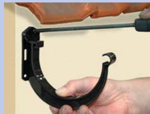
1-2 - Nostipriniet teknes āķus, ņemot vērā kritumu 3 mm uz 1 tekošo metru