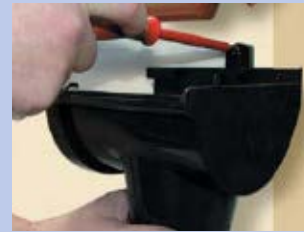
10 - Nostipriniet teknes savienojumu un piltuvi pie sienas, ņemot vērā 3 mm slīpumu