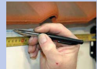
4 - Piestipriniet vajadzīgo kronšteinu daudzumu, ar attālumu 40 cm