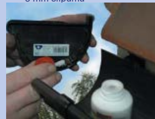
14 - 15 - Pielīmējiet ar pvc līmi teknes galu