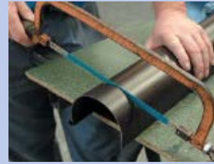
6 - Nozāģējiet vajadzīgo garumu ar dzelzs zāģi