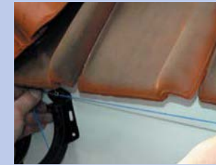
11 - Uz nākamās sienas atkal nostipriniet teknes āķus pēc iepriekšējā principa