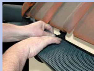
17 - Nostipriniet sietu