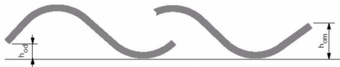
1.zīm. augšup un lejup vilnis.

Lokšņu nosaukumi: 585x920 – Cedral Gotika 875x920 – Cedral Villa