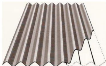
1.zīm. armēšanas jostas pozīcija loksnē