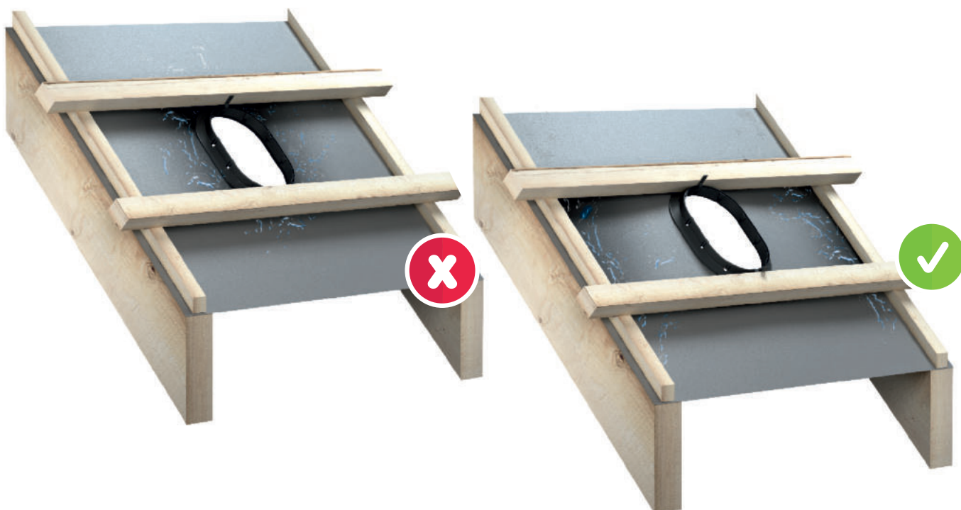
Apakšējais blīvējuma elements A